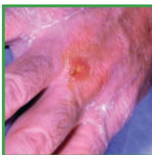
Razjeda na roki

Tularemija se ne prenaša s človeka na človeka.